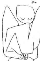
Angelo smemorato P. Klee, 1939

Gli angeli di Klee compongono una serie di 12 disegni su carta da minuta. Appartengono all'ultima fase della sua produzione e riflettono la profonda crisi dell'uomo e dell'artista. Nel '33 Klee ha lasciato la Germania per ragioni politiche, che culminano nel '39 con la messa al bando delle sue opere, che vengono eliminate dai musei tedeschi ("arte degenerata"). Dal '35 sa di essere malato di sclerodermia e nel '39 si trova in sanatorio, dove muore il 29 giugno 1940. La serie degli angeli si inserisce nella sua evoluzione artistica, che predilige il segno grafico e trascuria il colore. Il tema è trasparente, allude a "altro", a un bisogno di accudimento e di protezione. L'"angelo smemorato" ci è sembrato il più adatto a rappresentare, leggero e suadente, l'idea dolorosa del morire.