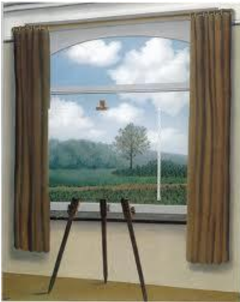
R. Magritte – La condizione umana, 1933