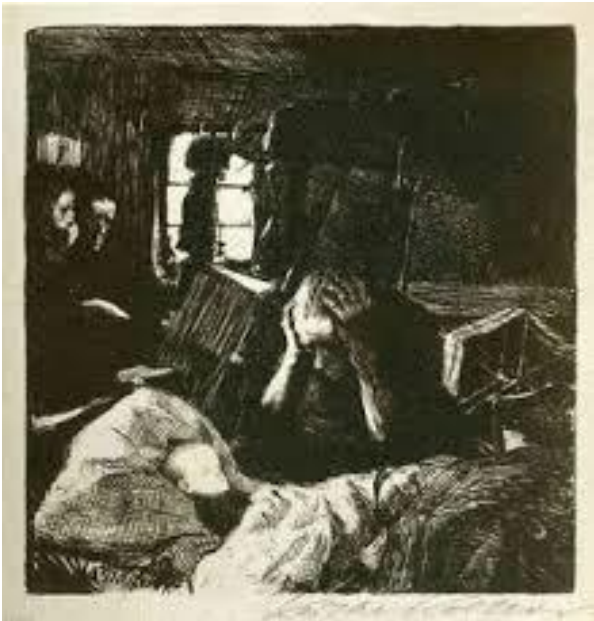
K. Kollwitz – Bisogno, 1901

il bisogno rappresenta l'impalcatura biologica dell'essere vivente ed è condizione comune a tutti gli esseri umani