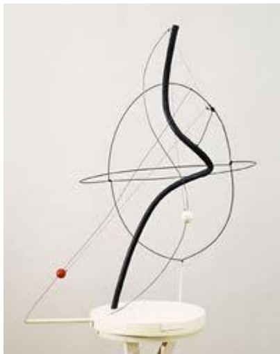
A. Calder – Un universo, 1934

Soddisfare tali bisogni non significa unicamente sussistere fisicamente ma anche e soprattutto entrare in relazione con gli altri costruire con loro un legame nella comune costruzione di un senso a ciò che accade.