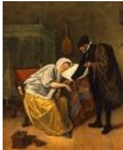
J. Steen – Il medico e il suo paziente, 1664

Master di primo livello in assistenza geriatrica