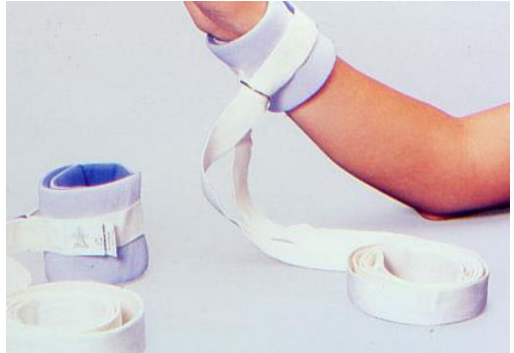
Bracciale di immobilizzazione