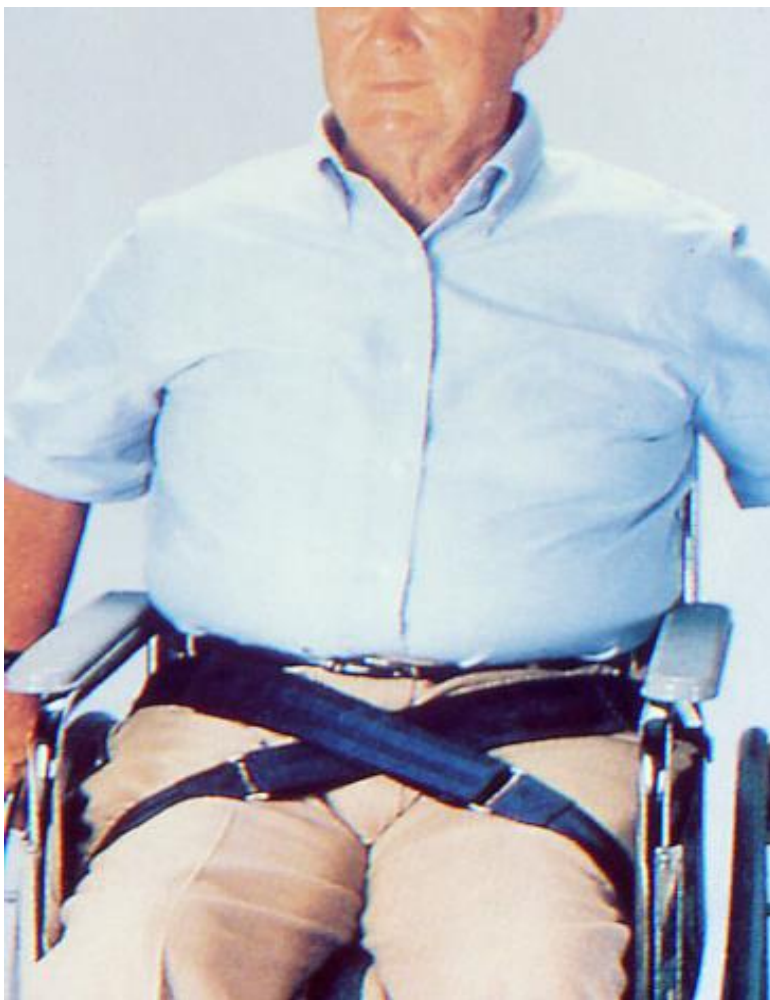
Sostegno per il paziente