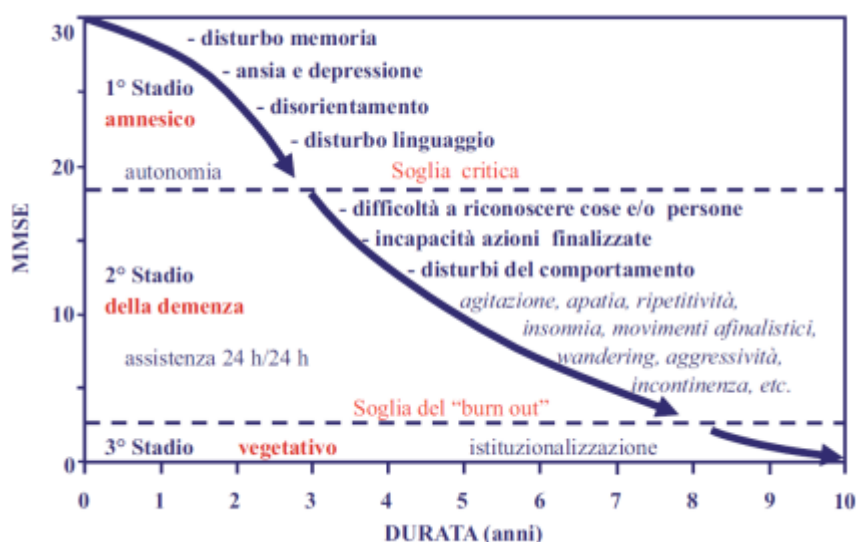
Figura 2: decorso della sintomatologia nella progressione della demenza di Alzheimer tipica

Nella demenza la compromissione cognitiva influenza negativamente la vita sociale e familiare del paziente che diventa un problema a causa del declino delle sue capacità funzionali; il decorso è gradualmente progressivo. Attenzione dovrà essere posta alla pseudodemenza e alle carenze