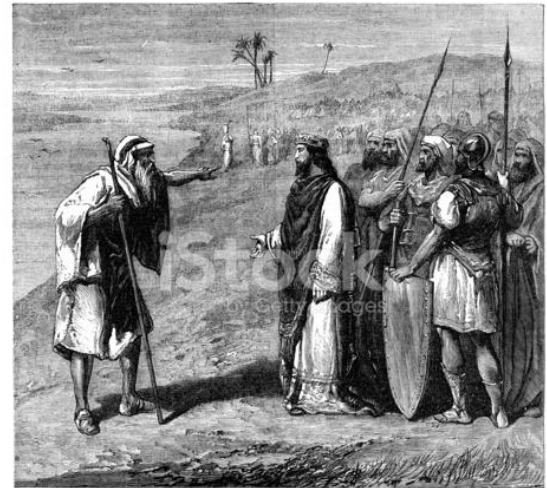
DAVID AND BARZILLAI.

Allo stesso tempo, però, l'uomo si distingue da ogni altra realtà che lo circonda, perché è persona. Plasmato ad immagine e somiglianza di Dio, egli è soggetto consapevole e responsabile. Anche nella sua dimensione spirituale, tuttavia, egli vive il succedersi di fasi