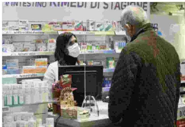
Milano Un anziano viene servito in una farmacia

Il fenomeno è in aumento, complice il progressivo invecchiamento della popolazione, la presenza di almeno due patologie croniche che riguarda il 75% degli over 60 e la quasi totalità degli ultra ottantenni. Secondo i dati OsMed in Italia il 30% degli over 65 prende 10 o più farmaci (nel 2018 erano il 22%