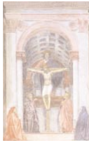
La Trinità di Masaccio.

Dal 16/09/2004 al 2/01/2005 Orario: 9-19