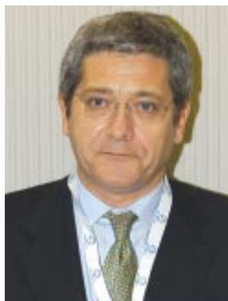
Il Professor Bernabei.

Nel simposio di ieri dedicato al tema tra i rapporti del dolore del corpo e la sofferenza della mente, la relazione di Roberto Bernabei non poteva che essere la prima. E questo non per una qualsiasi forma di tributo al Presidente Eletto della SIGG, (che entrerà in carica nel 2006), ma proprio per l'importanza dei concetti affermati e la chiara presa di posizione nei confronti del tema del dolore nell'anziano in rapporto alla sofferenza psichica: una chiarezza che è servita da presupposto e introduzione alle relazioni che l'hanno seguita. "Negli anziani di fatto il valore viene sottodiagnosticato e conseguentemente, spesso, non adeguatamente trattato" ha sottolineato Bernabei. "Si tratta di un problema estremamente serio perché si stabilisce una sorta di connivenza tra il me-