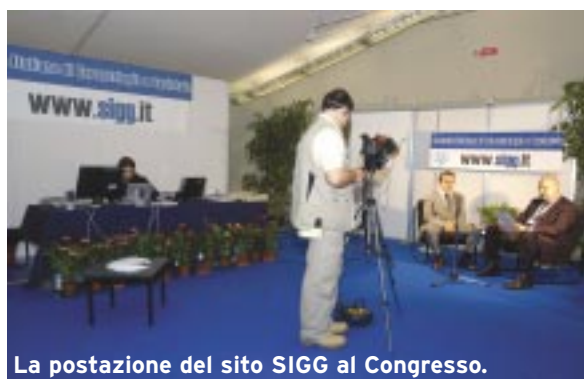
La postazione del sito SIGG al Congresso.